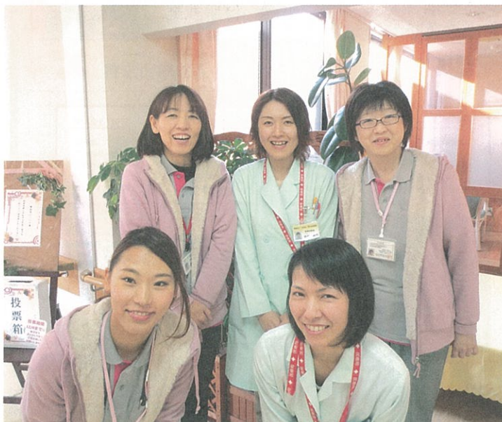
地域連携室メンバー

医療法人自由会として、この地域包括ケアシステムの中でどのように対応していくのかは今後の大きな課題です。現在は回復期リハビリテーション施設である岡山光南病院と、在宅医療に特化したこうなんクリニックが自立支援を目的とした医療活動に取り組んでいます。急性期病院で治療を終えた後に自宅へ戻る為の機能訓練や生活動作訓練等を集中して行う回復期リハビリテーション病院として岡山光南病院は近隣の急性期病院と連携して対応しています。岡山光南病院から