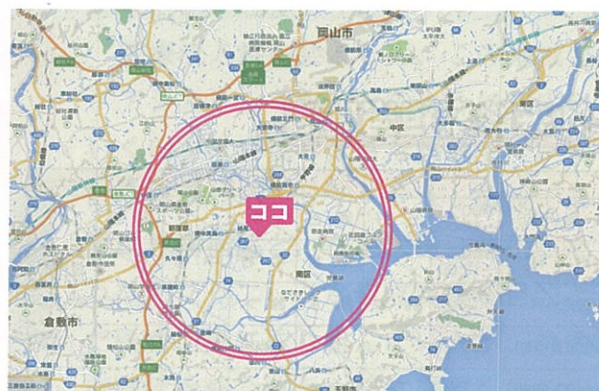
片道 20 分程度のエリア(目安)

単に歩けないから歩行訓練、固まるから痛くても手足を動かすというような原始的なリハビリは行いません。医師の指示のもと、問題となっている症状（歩けない、関節が固くなった、痛み等）の原因を考え、それに直接アプローチすることによって日常生活動作を向上させます。当ステーションのスタッフは病院でも勤務経験が十分にあります。皆様にとって身近で信頼できるよきかかりつけ理学療法士、作業療法士、言語聴覚士でありたいと願っております。