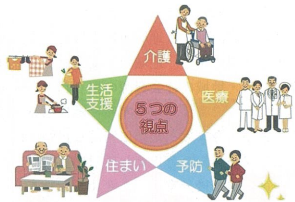
地域包括ケアシステム

この地域包括ケアシステムがうまく行われるためには、人生の最期をどこでどのように迎えるかについてそれぞれが考え、看取りを自宅や施設で迎えるケースを今よりも増やす取り組みが大きな課題となっています。現在は亡くなる方の8割以上が病院で最期を迎えていますが医療機関の病床数には限界があります。特別養護老人ホームや有料老人ホームで穏やかに見守られて最期を迎える取り組みも徐々に増えてきていますが、さらに自宅で最期を迎えるための取り組みとして