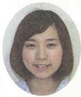
埜 幸歩 ノ ヲホ